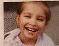
zij lacht _____