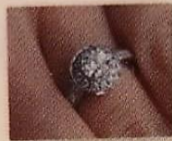
de ring _____