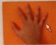
de pink _____