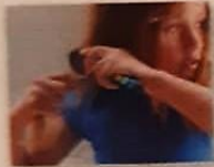
zij kamt _____