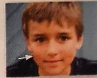
de wang _____