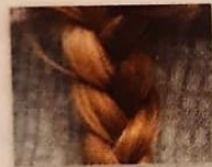
de vlecht _____