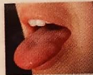
de tong _____