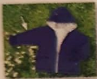
de mouw _____